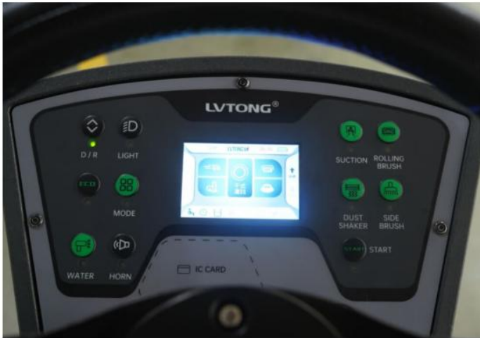
Panel de control de funcionamiento de alta definición