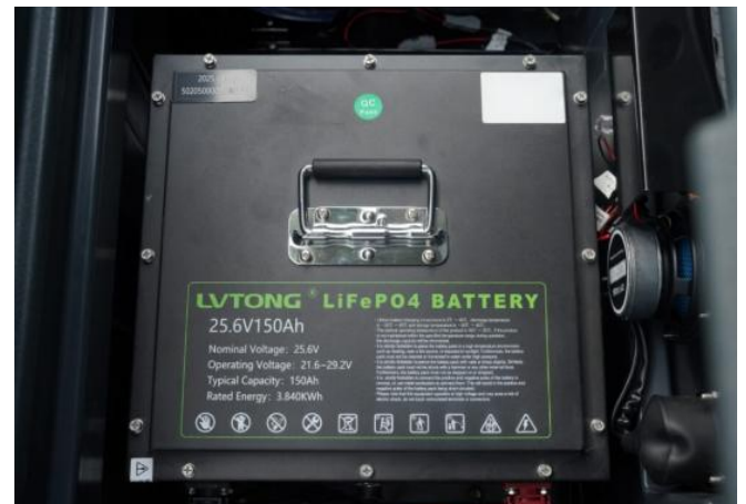
Batería de Litio de larga duración