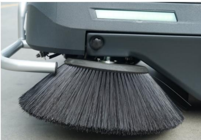
Escobillas densas de alta performance