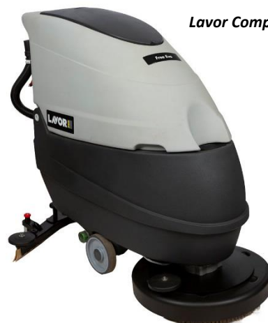
Lavor Compact Free