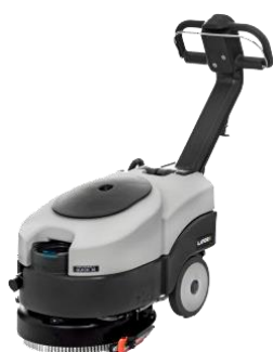
Lavor Quick 36