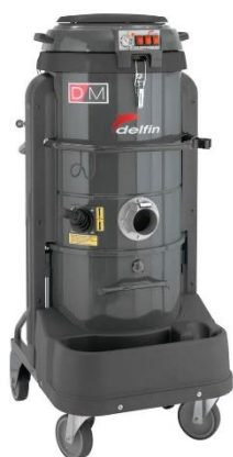
DM3 de 60 y 100 Litros