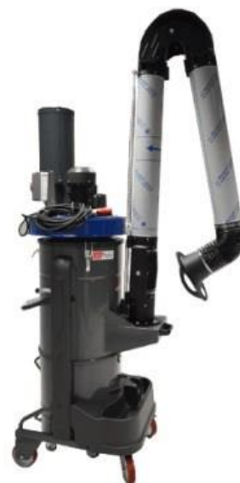
Zefiro Aspirador Extractor