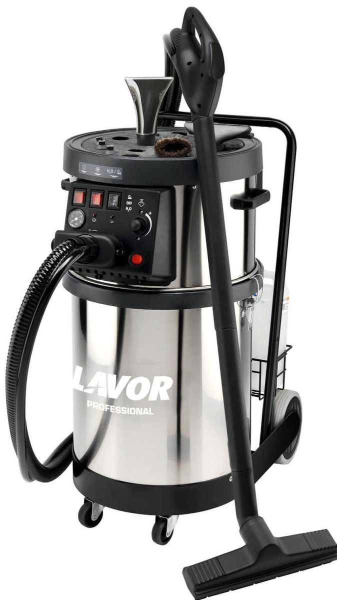
Lavor ETNA 4.1