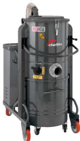
DG 50 EXP y DG 70 EXP