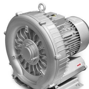
Motores de Canal Lateral