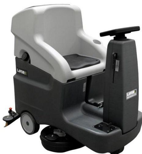
Lavor Comfort XXS