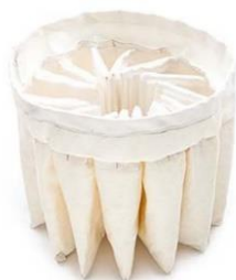
Filtro de Poliéster