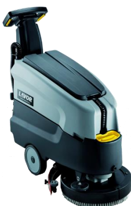
Lavor Dynamic 45