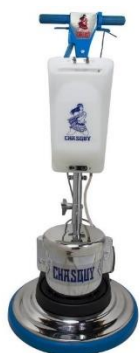
Lustradora con el tanque opcional