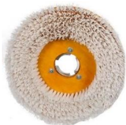
Escobilla de lavar de madera. Para modelos 8D12NM, 8D14NM, 8D18NM, 8D20NM y 8D23NM