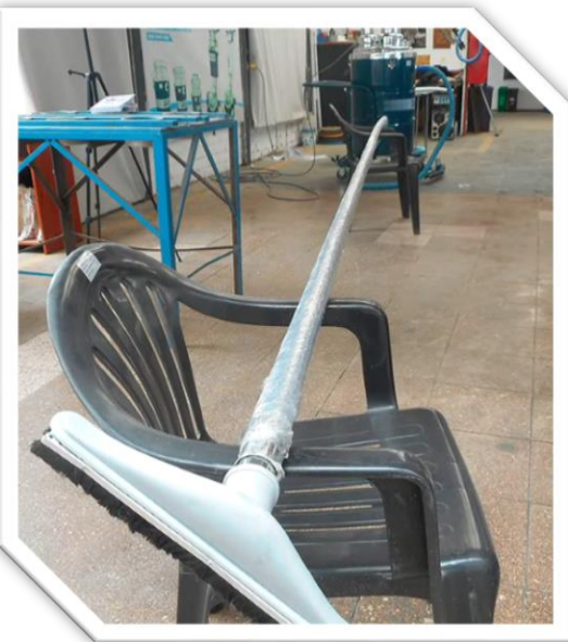
Extensión de PVC 05 metros

También podemos fabricarles extensiones de PVC de 03 metros o más para que el equipo pueda acceder a lugares de gran altura, usando nuestros accesorios. Aplicable para equipos de 02 o 03 motores.