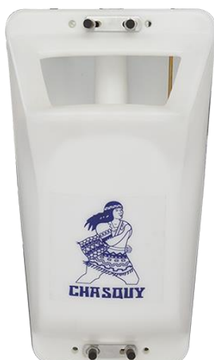
OPCIONAL: Tanque de 10 litros para mezcla de detergente líquido. Para modelos 8D16NM, 8D18NM y 8D20NM