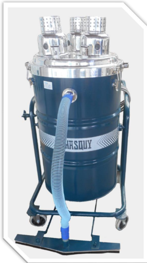
Accesorio de Barrer Incorporado