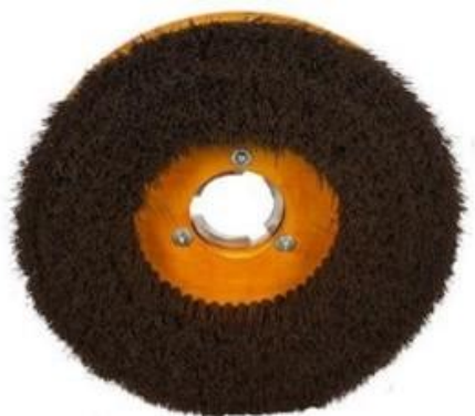
Escobilla de lustrar de madera. Para modelos 8D12NM, 8D14NM, 8D18NM, 8D20NM y 8D23NM