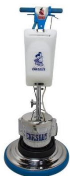
Lustradora con el tanque opcional