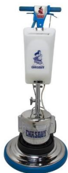
Lustradora con el tanque opcional