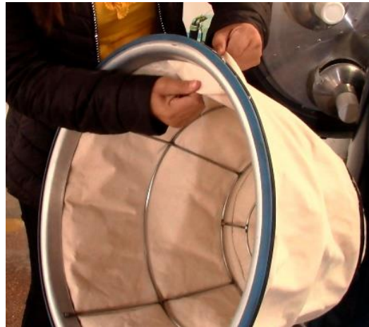
Filtro de Doble Capa

NOTA IMPORTANTE: Si necesita aspirar polvos finos o polvos muy finos por favor consulte a su asesor comercial para colocarle un filtro especial