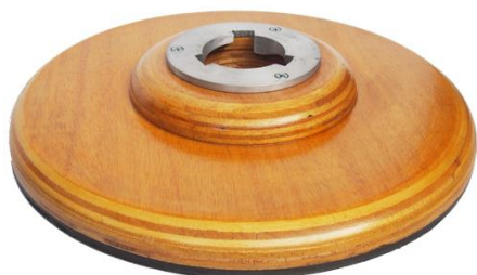
Portapad de madera. Para modelos 8D12NM, 8D14NM, 8D16NM, 8D18NM y 8D20NM